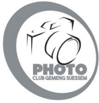
PHOTO CLUB GEMENG SUESSEM

Affiliéiert bei der FLPA Fédération Luxembourgeoise de la Photographie Artistique