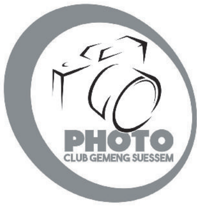
PHOTO CLUB GEMENG SUESSEM

Eis Aktivitéiten vum 6 Mäerz bis 24 Abrëll 2023